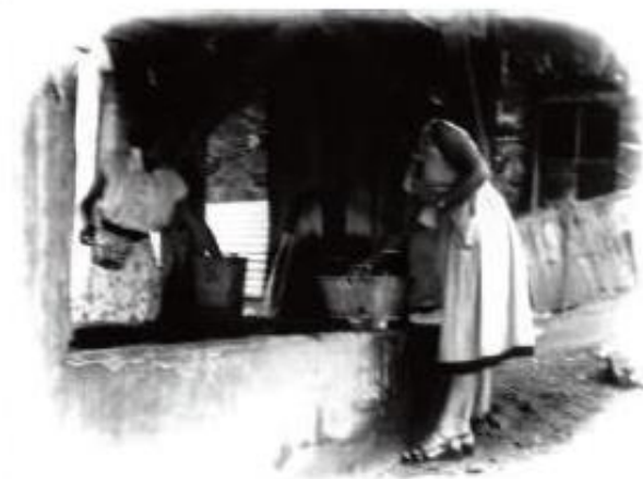
Quelques images, parfois floues, rappellent les usages anciens du bachal (vaisselle, lessive, transport de l'eau...). Le bachal était aussi un important lieu de rencontre où se sont échangés bon nombre de confidences mais aussi, parfois, quelques mémorables « crépages de chignons ».