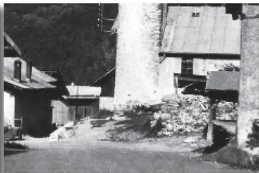
En 1962, l'eau potable arrive dans chaque maison, mais aussi dans un nouveau bassin (ci-contre), dont les abords seront aménagés ultérieurement. La place du village (ci-dessus), sera elle aussi totalement réaménagée après 1965. En attendant, le « bassin du haut », dont on aperçoit le bout du toit à droite, entre le four et l'église, va survivre encore quelques temps, toujours alimenté par la source de Crête-Ernoud.