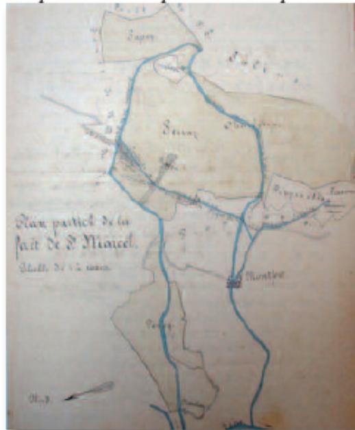
L'un des projets de captage sur le ruisseau de la Serraz. Ce plan indique également l'emplacement de l'ancienne source de Crête-Ernod, qui a alimenté le village pendant plusieurs siècles. (Vers 1870 - ADS)

Au début des années 1890, toutefois, de nouveaux rapports alarmants sont rédigés. Les experts, qui sont désormais des chimistes et biologistes écrivent : Le village de Montfort ne possède actuellement qu'une petite fontaine formée par la réunion de petits filets d'eau provenant des