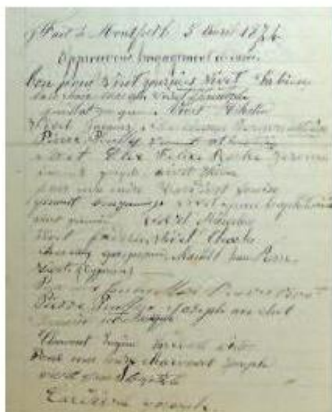
5 avril 1874 - Acte de souscription volontaire des Montfortains, qui s'engagent à fournir 10 à 20 journées de travail par famille pour permettre la construction de leur nouvelle conduite d'eau. (AMf)

Le village restera desservi par cette eau pendant une soixantaine d'années, période dont les habitants garderont le souvenir mitigé d'une eau de qualité très variable. Par temps de pluie, par exemple, il était tout bonnement impensable d'envisager