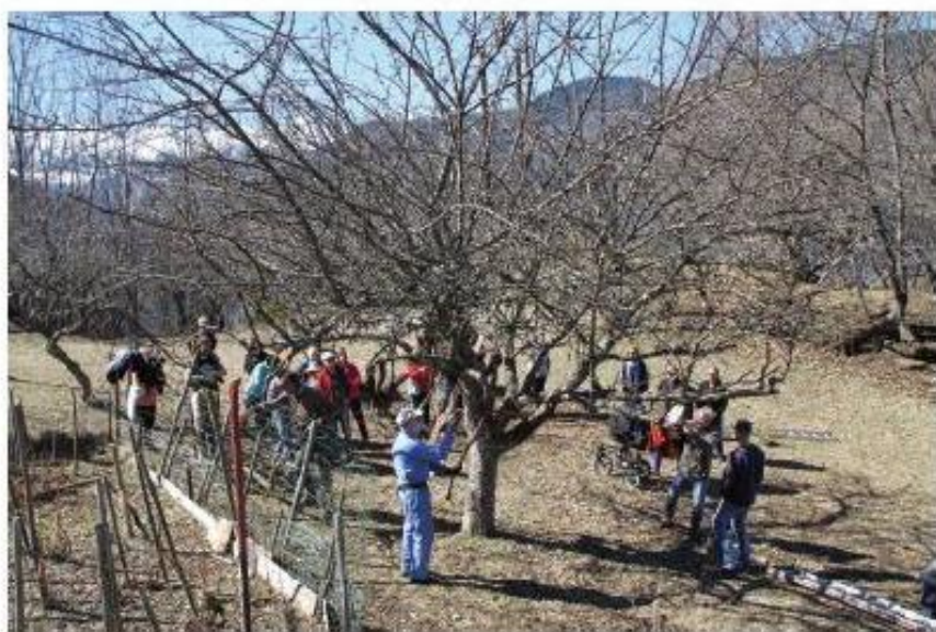
Dans le verger sous le cimetière. Les Croqueurs s'en donnent à cœur joie sous l'œil attentif des apprentis tailleurs.