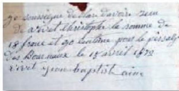
Reçu pour le paiement de la fabrication (« le perçage ») de bourneaux en 1872