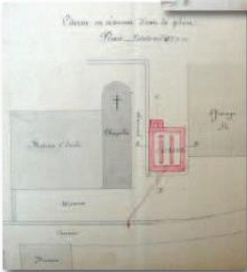
Le projet de captage des eaux de la Serraz comprenait aussi l'idée originale de créer un réservoir d'eau de pluie au beau milieu du village, qui aurait servi de réserve pour les usages non alimentaires (arrosage, lavage de certains ustensiles...) Mais cette partie du projet restera sans suites. (ADS)

de boire cette eau, ni même d'entreprendre des lessives, parce qu'elle charriait de grandes quantités de terre... Ce qui explique pourquoi on continua, sur toute cette période, à entretenir précautionneusement la source et la conduite de Crête-Ernoud, malgré son débit chaotique, et on utilisa l'eau de la Serraz plutôt comme une ressource d'appoint.